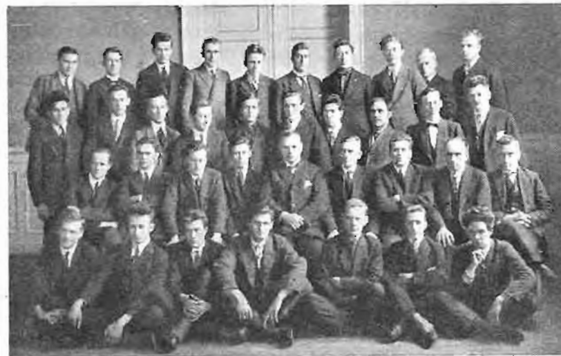
Opplæringskurset i 1924.

læringen i praktisk journalistikk var kommet i ordnede former gjennom et lærlingssystem som ennå består og som i praksis har vist gode resultater selv om det sikkert kan utvikles til større fullkommenhet, særlig ved utveksling av lærlinger i avisene.